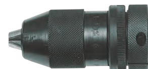
Con innesto filettato

Tipo pesante per trapani a colonna, radiali, torni e fresatrici