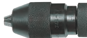
E 1120/3 - Con innesto conico

Tipo industriale con ghiera per trapani a percussione