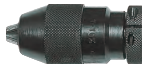
Con innesto conico

* E 1120/5: lunghezza chiuso 81 mm - Diametro esterno max. 44 mm