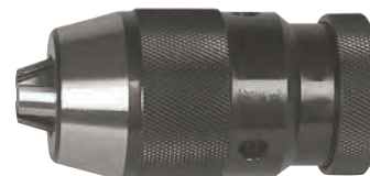
Con innesto filettato