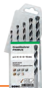
B 3630 /7 gr.5